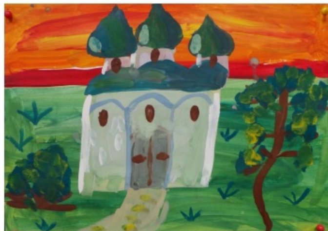
Козлов Богдан 2Б

используются наглядные пособия, которые привлекают внимание детей, вызывают у них эмоциональную реакцию. Дети осваивают технику